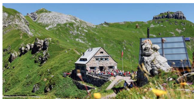
Kann bis dort mit E-MTB-Bike hinauf fahren.