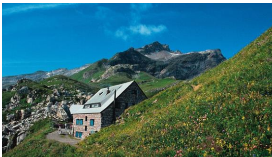
Pfälzerhütte vor Gipfel Naafkopf